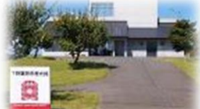
下野薬師寺歴史館