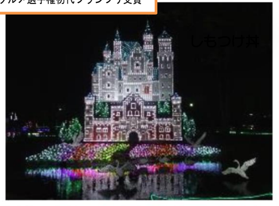
グリムの森イルミネーション